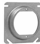
TP473, TP476, TP475, TP479