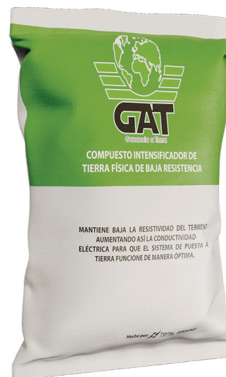
Las imágenes son exclusivamente de carácter ilustrativo y están sujetas a modificaciones.