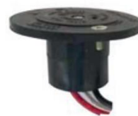
KOBALIGHT RECEP (0713108) Receptáculo