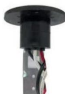
KOBALIGHT ACCS (0713102) Receptáculo y ménsula